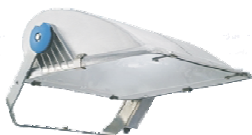
Planflächenstrahler MVP 507 für Metallhalogendampflampe MHN-LA 2000W / 842